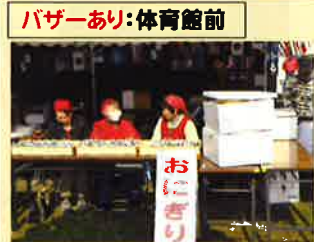
バザーあり:体育館前