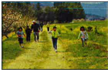
おおつるの春を堪能しましょう!!

「ウォーキング!!」のみの参加!! 「復興春まつり」のみの参加!! も OK です。