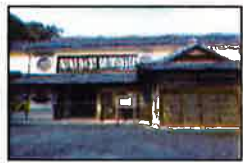
井上酒造・清溪文庫