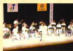
大分県警察音楽隊