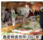
農産物直売所「De・愛」

●農産物直売所「De・愛」 川崎町の特産品をたくさん販売しています。おいしいものと楽しい笑顔に出会ってください。